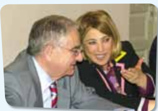
Maryse JOISSAINS MASINI > Président de la Communauté du Pays d'Aix, > Député-Maire d'Aix-en-Provence

Lors de cette journée, les bus, cars et parcs-relais du Pays d'Aix seront gratuits. Je vous invite donc à nous rejoindre nombreux sur le cours Mirabeau à Aix-en-Provence.